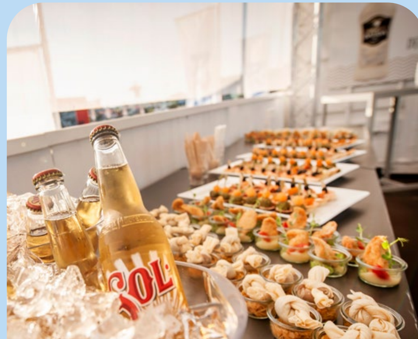
Chill & Surf