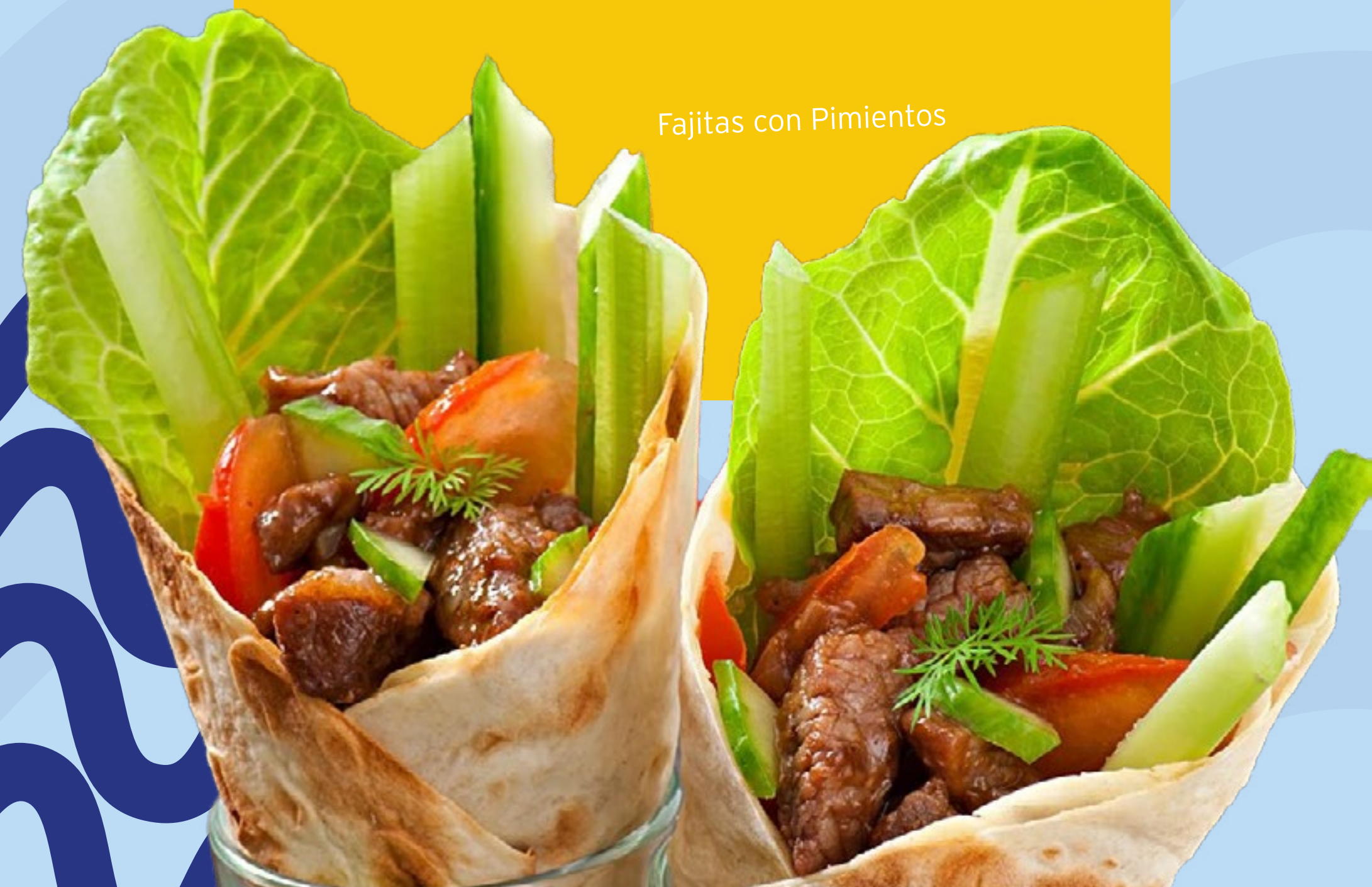
Fajitas con Pimientos