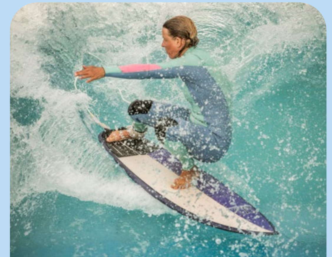
Surf & Drinks