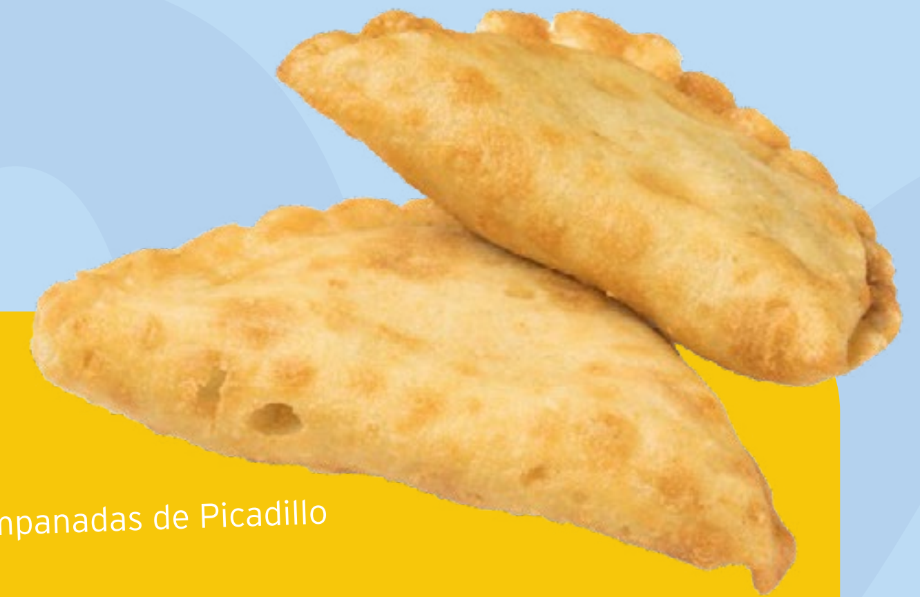
Empanadas de Picadillo